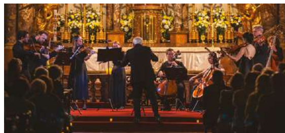
Ensemble Les Orpheistes

Symphony No. 5 in B flat, K.22 Klavierkonzert A-Dur, KV 414 Sinfonia concertante für Violine, Viola und Orchester Es-Dur, KV 364