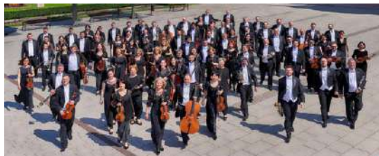
Philharmonisches Orchester Győr