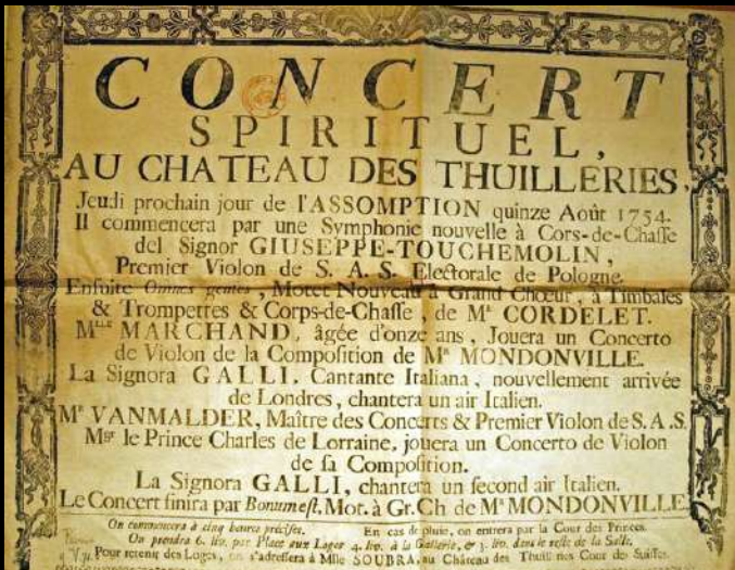
Poster advertising the Concert Spirituel to be held on 15 August 1754

Bild vorne: Bernardo Bellotto, gen. Canaletto, Neue Burg, Sammlung alter Musikinstrumente - Der Mehlmarkt in Wien - GG 1668 - Kunsthistorisches Museum