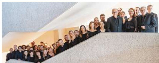
Philharmonia Chor Wien